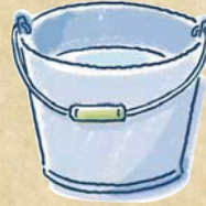
[水] 9.6 L